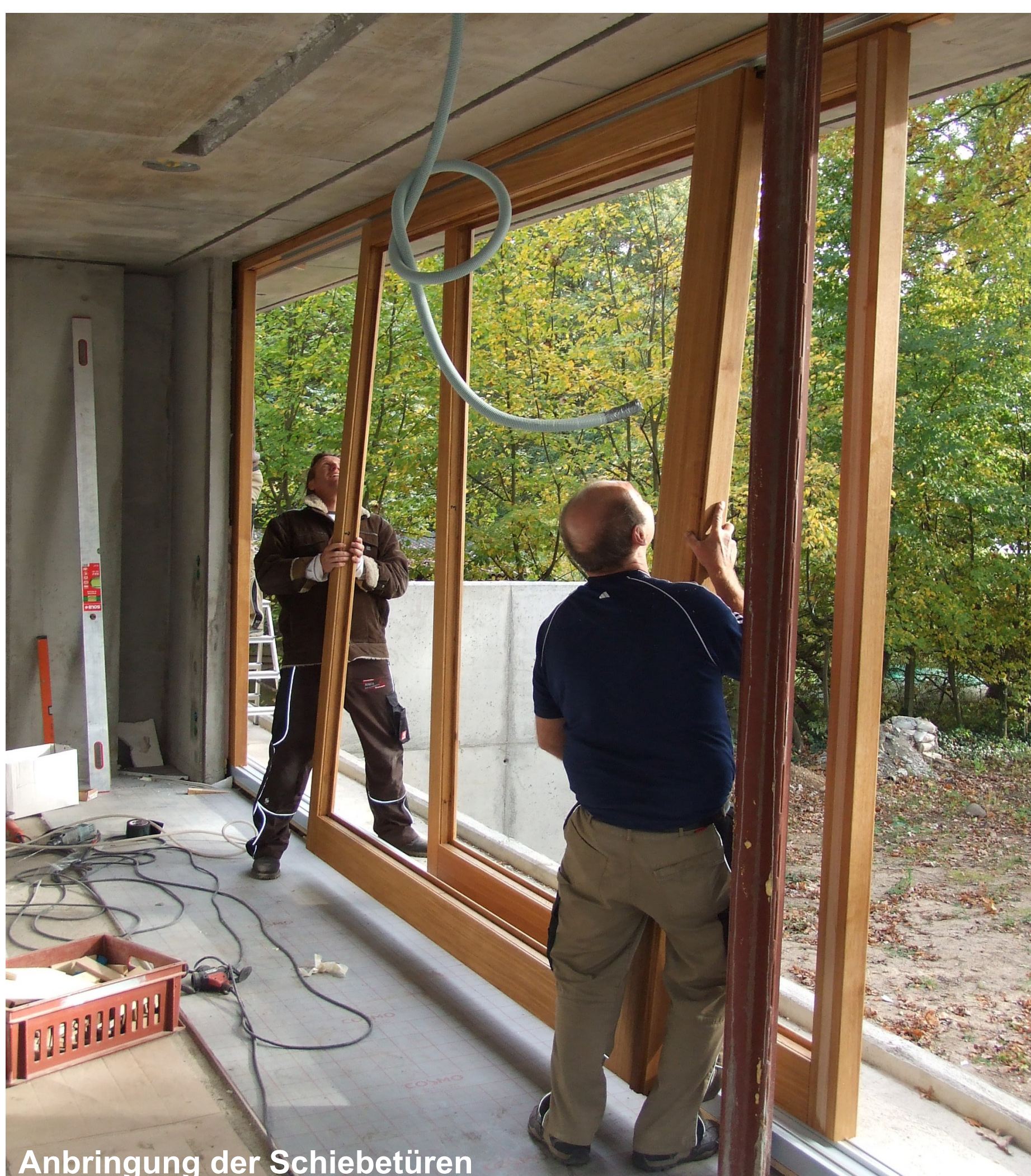
Anbringung der Schiebetüren